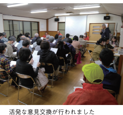
活発な意見交換が行われました

●今年も年末パトロールを予定 今年は大晦日直前の12月29日(金)15時から恒例の年末防犯パトロールを開催します。町会会館前にて受付、東中新宿第7公園から各ブロックに分かれて実施を予定しています。私達の地域が今年も無事に年を越せるように取り組みましょう。