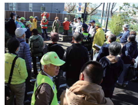
柏市職員から蓄水施設の説明を受けました

町会役員会からのお知らせ 町会会館内のフロア照明設備がLEDにリニューアルしました。館内が見違えるように明るくなり、また電気代も軽減されました。老朽化し破損が目立っていたフェンスもまもなく改修の予定です。私達の共有財産を各班の小さな打合せや様々なサークル活動などにもぜひお使いください。 ●町会会館の補修作業