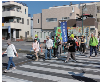
ゴールに向かって、歩いて歩いて

方々が参加され、当町会からはその中でも最も多く、全体の1/3を占める90名あまりの参加申込がありました。好天に恵まれ、散歩日和となりました。