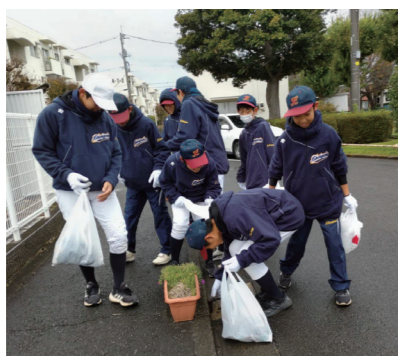
光中野球部のメンバーもごみ拾い

11月12日(日)9時から町会地域内の美化運動としてのクリーンデーを実施しました。各地に設置されたポイントを経由して、ごみ拾いを行い、みどりの広場にて