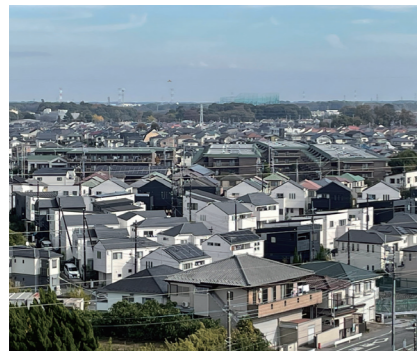
家々が建ち並ぶわが町会

聴講した後に、参加者自身が避難者の受付業務を実習しました。その後、光ヶ丘中学校を避難所とした場合の校舎内の使用予定場所を見学しました。そして、正門横に設置された柏市災害用給水設備の見学、向かいの中原ふれあい防災公園にある災害用トイレ設備、貯水設備を見学、説明を受けました。 今年、関東大震災発生100年です。阪神淡路大震災や東日本大震災の光景を思い出させられます。このような訓練を続けることは決して容易ではありませんが、経験と知識を重ねることで、被災対応ができていくために、避難所運営の体制作りや訓練内容を発展させていきたいものです。