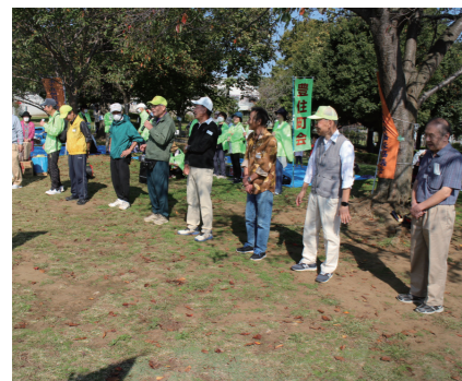
各町会長さん達のごあいさつ

方々が参加され、当町会からはその中でも最も多く、全体の1/3を占める90名あまりの参加申込がありました。好天に恵まれ、散歩日和となりました。