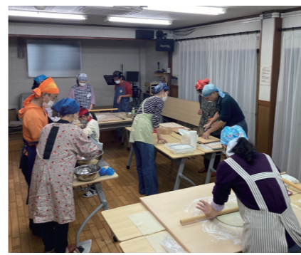
手作りのそばができてくる

年末には第2段として「手打ち年越しそば体験教室」も企画され、実施する運びとなりました。