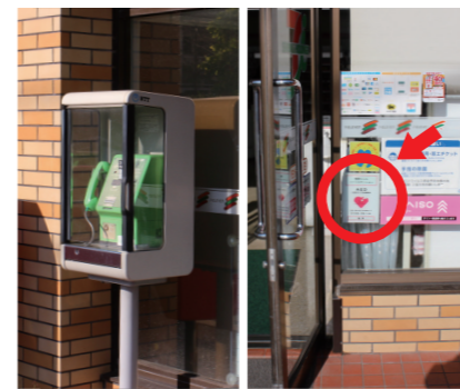
公衆電話とAED備付マーク

火器や掲示板、そして公衆電話、AEDを散策しながら見つけてみようというものでした。これは、町会員の皆さんに災害時の対応意識を高めていただくためのイベントでもありました。散策時間は1時間、その後みどりの広場に