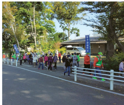
ゴールめざしてがんばりましょう