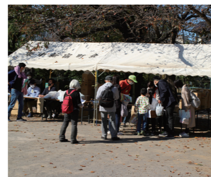
最後にたくさんのお土産を手にして

火器や掲示板、そして公衆電話、AEDを散策しながら見つけてみようというものでした。これは、町会員の皆さんに災害時の対応意識を高めていただくためのイベントでもありました。散策時間は1時間、その後みどりの広場に