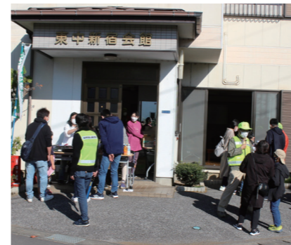
会館前で受付して、いざ出発

「ウォーキングで発見しよう、東中新宿のこう？」 新型コロナウイルス感染症の第7波が願うほど下がり切らない日々の中で、今年も町会運動会「ふれあいデー」は開催を見合わせる事になりました。その代替企画として昨年に引き続き、町会内を散策するウォーキングを11月6日(日)に実施しました。 今年のサブテーマは「ウォーキングで発見しよう、東中新宿の???」。