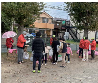
たくさんのゴミを回収しました

11月20日(日)9時から町会地域内の美化運動としてのクリーンデーを実施しました。班ごとに決められた場所に集合して軍手を受け取り、ごみ拾いを行い、みどりの広場にて分別回収しました。当日は肌寒い曇り空から小雨交じりの朝になりましたが、129名というたくさんの皆さんが参加されました。ご協力ありがとうございました。