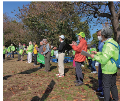
ゴールした公園での参加町会長のあいさつ