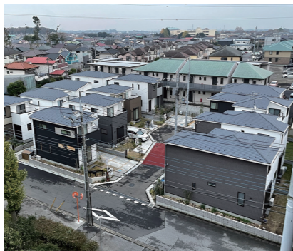
一年前は月極駐車場でした

役員を兼ねる形で何とか活動を継続しています。役員の任期は2年間と定められており、次年度は役員改選期となります。これから次年度総会に向かつて諸手続きが行われますが、町会員の皆さんから新たな役員になっていただく方を改めて募集しています。町会にはいろいろな経験をお持ちの方々がお住