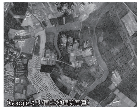
今から65年前・1957年頃のわが町会周辺