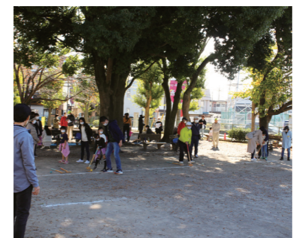
広場では親子でランドゴルフ

当日は天候にも恵まれ、ベビーカーを引く若いご家族から、ご年配のご夫婦まで、にぎやかに楽しまれました。意外にあちこちに設置されている赤い消火器ボックス、こんなところに町会の掲示板がある、公衆電話はここにここだけ、AEDはこの施設にあるなど、