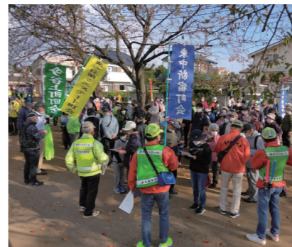
さあこれから出発です

当日は天候にも恵まれ、ベビーカーを引く若いご家族から、ご年配のご夫婦まで、にぎやかに楽しまれました。意外にあちこちに設置されている赤い消火器ボックス、こんなところに町会の掲示板がある、公衆電話はここにここだけ、AEDはこの施設にあるなど、