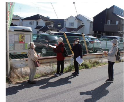
ここにも町会掲示板がありました