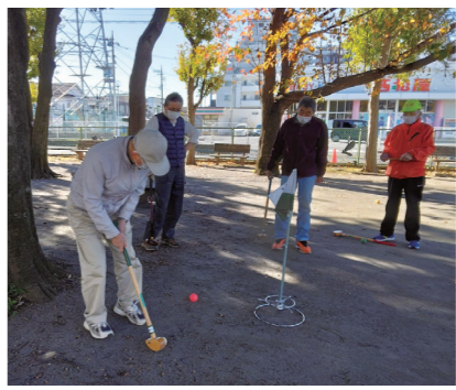
ラストショットでボールイン

11月20日(日)9時から町会地域内の美化運動としてのクリーンデーを実施しました。班ごとに決められた場所に集合して軍手を受け取り、ごみ拾いを行い、みどりの広場にて分別回収しました。当日は肌寒い曇り空から小雨交じりの朝になりましたが、129名というたくさんの皆さんが参加されました。ご協力ありがとうございました。