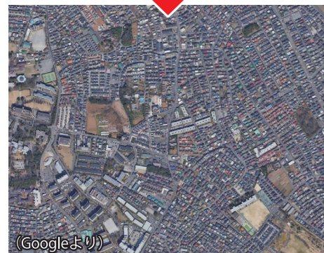
(Googleより) 2021年頃のわが町会周辺