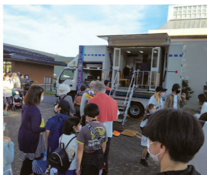
起震車の前には長蛇の列となりました

公園では、協議会会長の挨拶に始まり参加町会・自治会の町会長さん達が紹介されました。その後全員でくじ引きやじゃんけん大会を楽しみました。そして、各町会に分かれて心地よい空気の中での昼食時間になりました。日頃はふれあうことがない他町会の皆さんを目にしながら、この地区で共に暮らしていることを知る機会となりました。