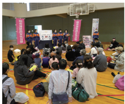
柏市消防団女性分団によりレクチャー

ポットなどの展示、地震体験車体験、消火器実習、パトカー、白バイ乗車体験などが行われ、来場者の長い列ができていました。 ※左の2枚は、防災の日の数日前、8月末に実施された光ヶ丘中学校避難所訓練の写真です。私達の身近に現実にはこのような場面が起こらないことを願うばかりですが、それでも万が一のための備えと訓練は欠かせないものではないでしょう。