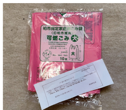
可燃ゴミ袋が配布されました