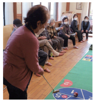
会館にてゴルフゲーム