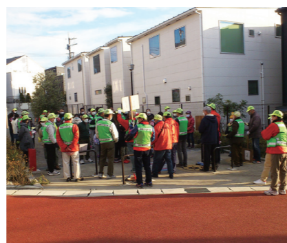
東中新宿第7公園に集合