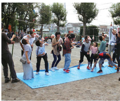
3年前のふれあいデーの風景

お願いします。 万が一の災害の際や避難訓練の際には各班でリーダーとなっていたために、班長には防災ヘルメットが配付され班長交代と共に新班長に引き継がれてきました。しかし、使用期限の関係から4月には新しいヘルメットを新班長に配付する予定です。近年はコロナ対応のために訓練も行われていませんが、班長引き継ぎの際にはヘルメットの有無の確認も忘れずに行ってください。