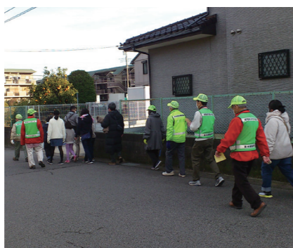
さあこれからパトロール出発