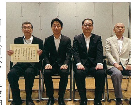
表彰式にて記念撮影