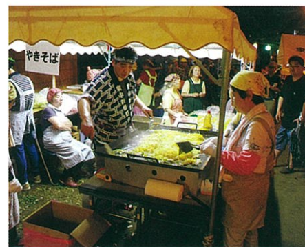
おいしいやきそばができてくる