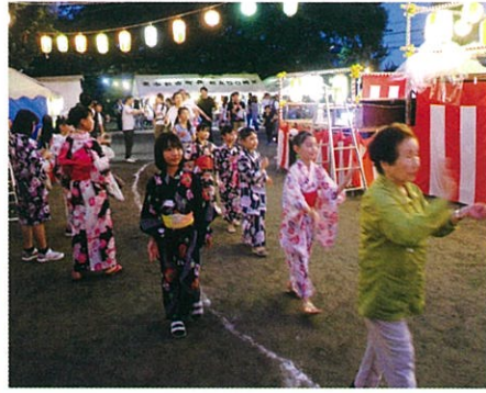
子どもも大人も踊りの輪になって