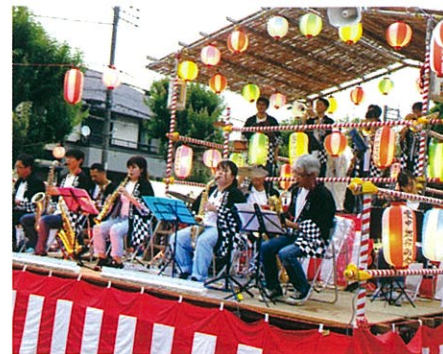
スイングビート・チーム・ヒロシさん演奏