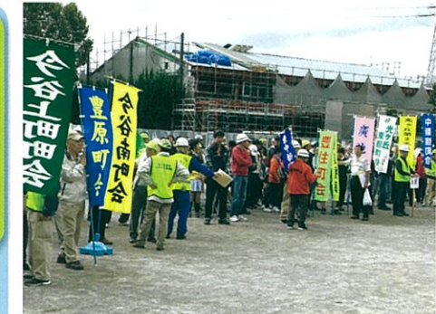
昨年の防災訓練 (光小に集結)

自転車のベル(警告器)は絶対つけなくてはならないものではない。 (正解はいいが)