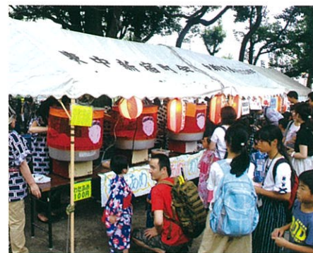
綿あめ作りは大忙し