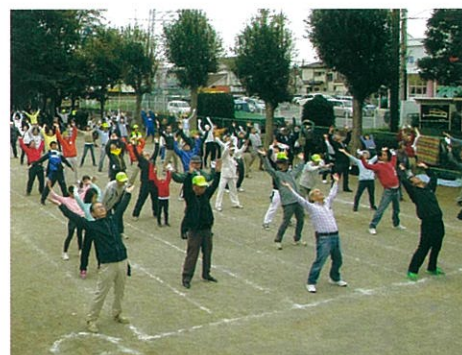
ふれあいデーのラジオ体操

今年も東中新宿みどりの広場にて老若男女、世代を超えてふれあい、思い出作りができる地域の一大イベントです。1等〜3等および参加賞などたくさんのお品を用意しています。毎年持ちきれ