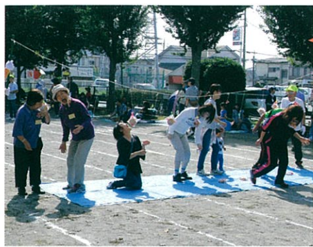
毎年盛り上がるパン食い競争

今年も東中新宿みどりの広場にて老若男女、世代を超えてふれあい、思い出作りができる地域の一大イベントです。1等〜3等および参加賞などたくさんのお品を用意しています。毎年持ちきれないほどのお土産になります。ぜひ皆さんの参加をお待ちしております。また、昼休憩には自主防災会とひまわりの会による炊き出し訓練を実施して、炊き出しの豚汁とおにぎりが振る舞われます。各班で出場のための申込用紙の回覧が始まっています。まだ見かけてない方は班長さんにお尋ねください。