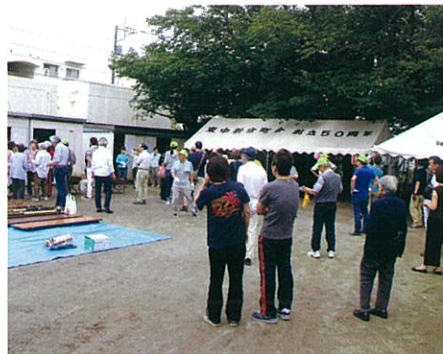
皆で会場準備をがんばりました