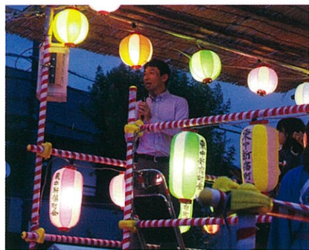
やぐらの上からあいさつされる柏市長