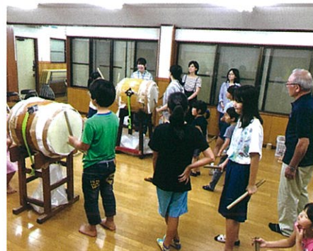
たいこの練習が始まる