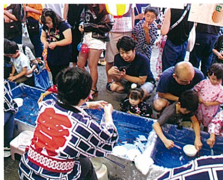
金魚すくい、がんばって