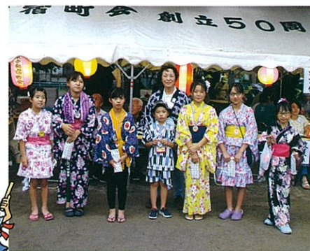
子どもポスター展表彰者の皆さん