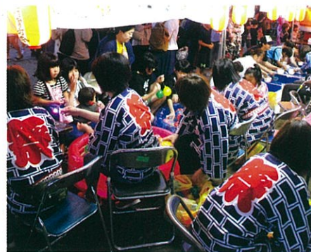
ヨーヨー釣りはお客が次々と