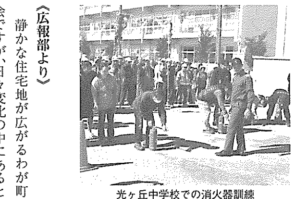
光ヶ丘中学校での消火器訓練

●光ヶ丘地区防災訓練 き出し訓練を実施しました。二十kgの米でたくさんのおにぎりを作り、豚汁と共に参加者全員に提供し、大変喜ばれました。本番ではこんなにも穏やかな雰囲気ではないでしょうが、万が一の訓練と経験が何より大事です。お手伝いしてください。皆さま、ご苦労様でした。