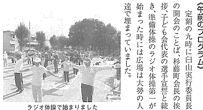
ラジオ体操で始まりまし

雨の影響で一日延期となった十月十二日(月)体育の日、みどりの広場にて約四百名の皆さんが町会の運動会を楽しみました。