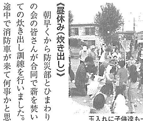
玉入れに子供達も一生けんめい

「昼休み(炊き出し)」 朝早くから防災部とひまわりの会の皆さんが合同で薪を焚いての炊き出し訓練を行いました。