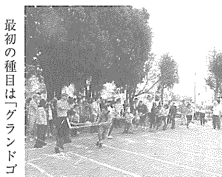
がんばれ、親子レース

大人気の「親子レース」。二本の棒にボールを載せ呼吸を合わせてカラーコーンを一周しゴールへ向かいます。