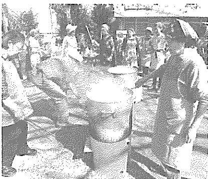
吹き出し訓練もおもしろ

プログラムの、幼児から年配者まで全世代の人が一緒に楽しめる十八種目で、勝ち負けより参加して町内の人達とふれあうことが目的です。