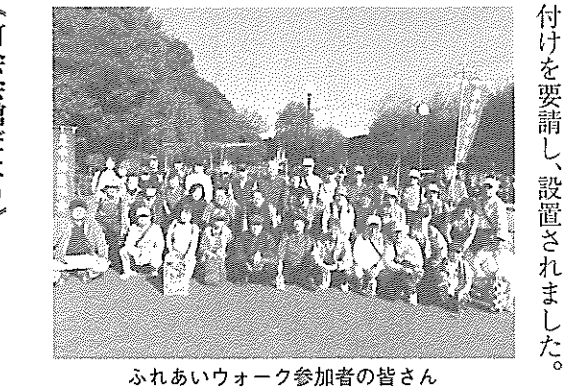
ふれあいウォーク参加者の皆さん

「町会だより」は三ヶ月に一回発行されます。そのため、記事の中には予定として記述されている方も、皆さんの手元に配布される際には、すでに実施済みになっている出来事もあります。