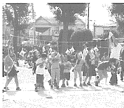
パン食い競争はいつも必死です

「玉入れ」では小学生の部は接戦でしたが、三歳以上の幼児と六十五才以上の対決は、付き添いのお父さんたちが頑張りました。