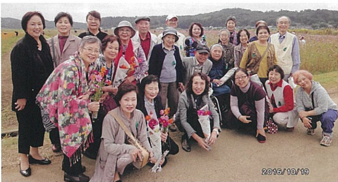
スタッフ・ゲストいっしょに日帰り旅行

東中新宿子ども会は、幼児と光ヶ丘小学校と中原小学校の子ども達38名で活動しています。また、役員は7名で運営しています。働いている方、小さいお子さんがいらっしゃる方もいますが、自分達のできる範囲で協力して行っています。