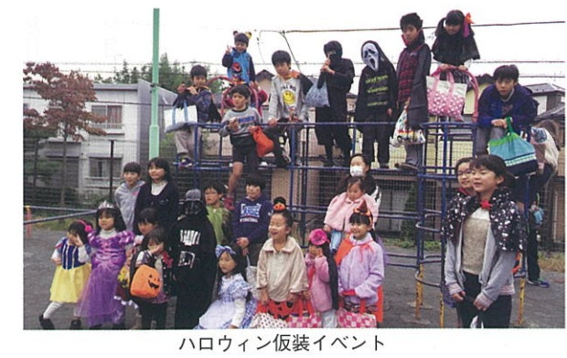
ハロウィン仮装イベント

12月/クリスマス会 (ボーリング) 3月/親子バス遠足(予定) ※防災公園で行っている芋掘り、落花生掘りのイベント(6月、11月)にも参加しました。