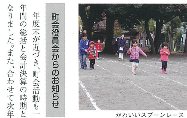
かわいいスプーンレース

町内在住の中学生以下の幼児・児童・生徒を対象に、回覧にて参加者を募集したところ、90名を超える応募がありました。