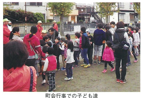
町会行事での子ども達