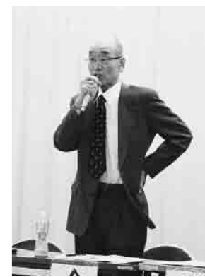
総会での会長あいさつ