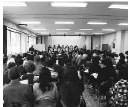
会場は満席になりました