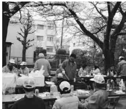
BBQを楽しんだ花見の会

● 町会総会 四月二十四日(日)、町会総会が開かれました。毎年参加者が増えている中、今年も進行を早くしようという工夫を凝らしました。来年は特に質問への対応を的確にできるように努力したいと思います。