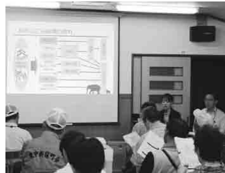
柏市役所職員の説明を聞きました

● 環境厚生部より ● ゴミゼロ講習会を開催 五月二十八日(土)午後七時から町会会館において町会役員、各班の班長、副班長が参加した「ゴミ処理講習会」を開催しました。当日は柏市環境部廃棄物政策課